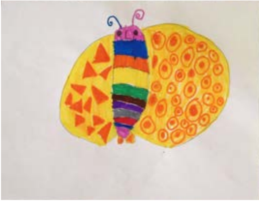
Dibujo 10 “Una mariposa”