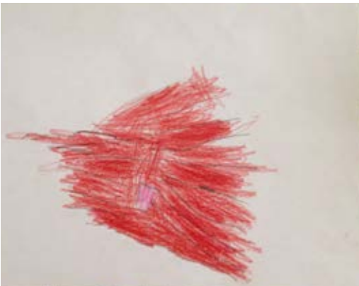
Dibujo 9 “Es una araña”