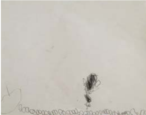
Dibujo 8 “Un escarabajo rinoceronte y una telaraña”