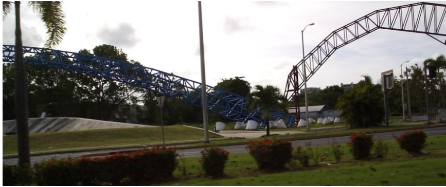
Etapa Intermedia de la construcción

El proceso creativo varía de acuerdo a la obra así como el artista. Múltiples vertientes se entrelazan temporal y espacialmente hasta que una obra de esta magnitud se completa. Una obra monumental de excelencia, tiene la particularidad de retener la magia y el magnetismo para el espectador aún después de un proceso extenso, como es el caso de la producción de esta grandísima escultura que tomó varios años. Para los espectadores de paso por las carreteras continuas a la plaza donde se ubicó la obra, comenzó como un misterio sobre qué se instalaría allí y para qué se estaba construyendo. A medida que pasaba el tiempo e iban apareciendo más piezas se develaba la intención.